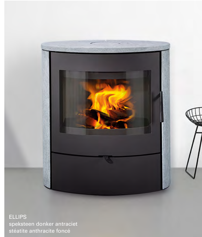
ELLIPS speksteen donker antraciet stéatite anthracite foncé