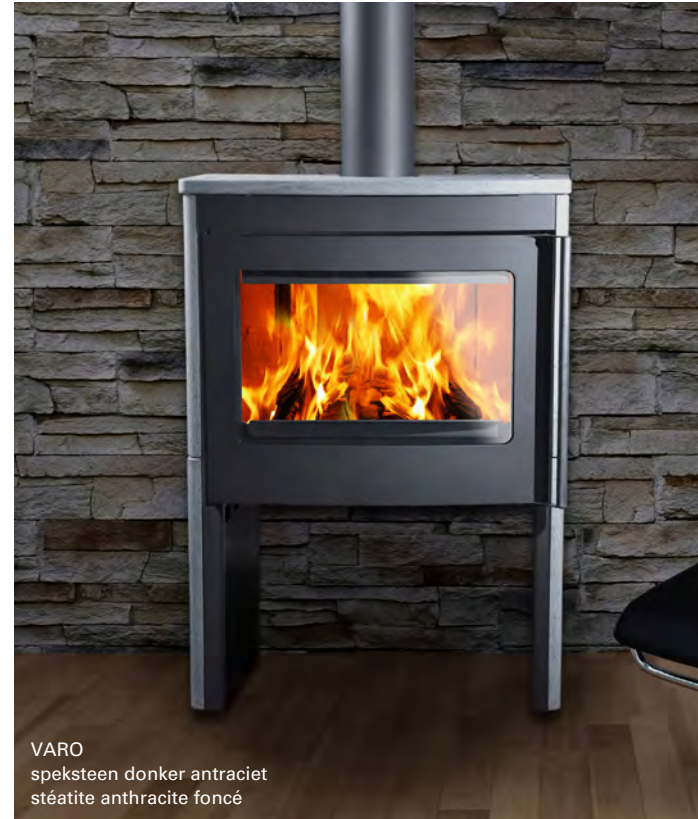
VARO speksteen donker antraciet stéatite anthracite foncé