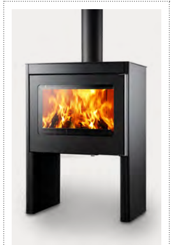
VARO plaatstaal donker antraciet acier anthracite foncé