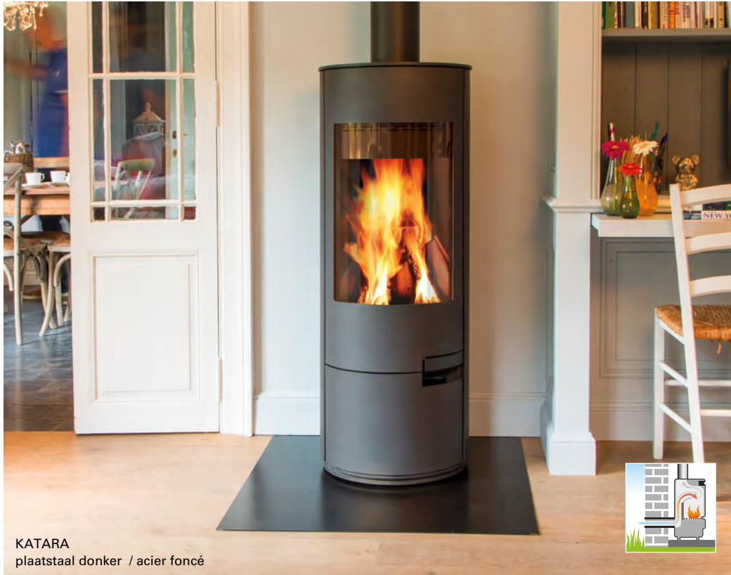
KATARA plaatstaal donker / acier foncé

Mooie, strakke volledig afgeronde kachel.