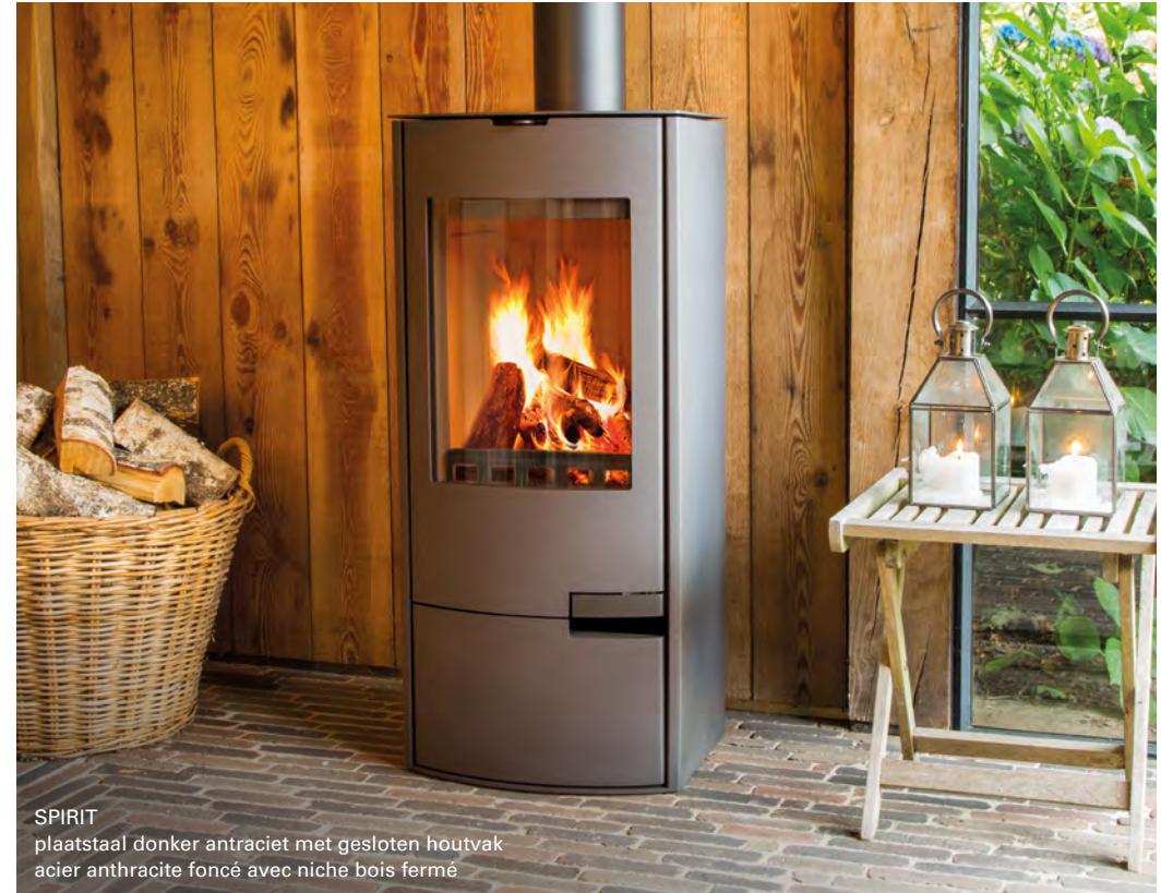
SPIRIT plaatstaal donker antraciet met gesloten houtvak acier anthracite foncé avec niche bois fermé

Strak, eenvoudig en tijdloos: de Spirit Staal!