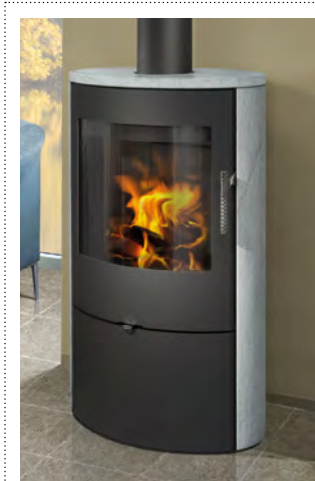
ELEGANT speksteen / stéatite