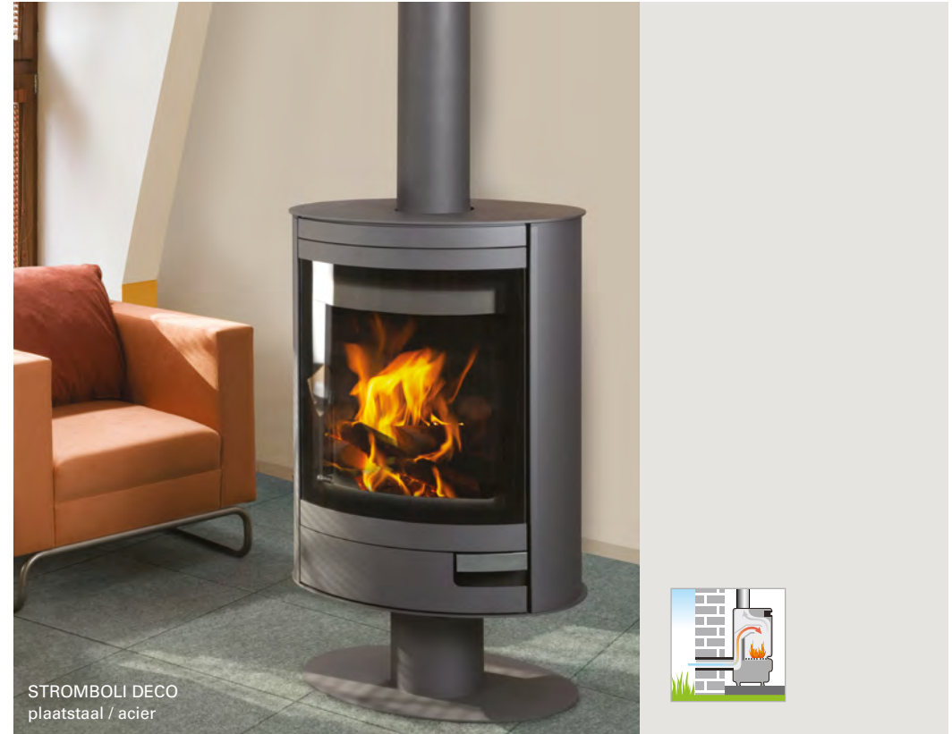
STROMBOLI DECO plaatstaal / acier