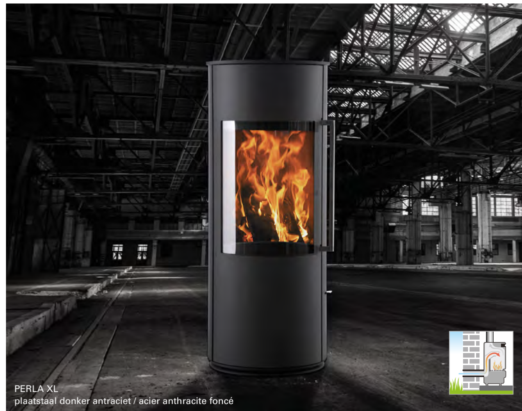
PERLA XL plaatstaal donker antraciet / acier anthracite foncé