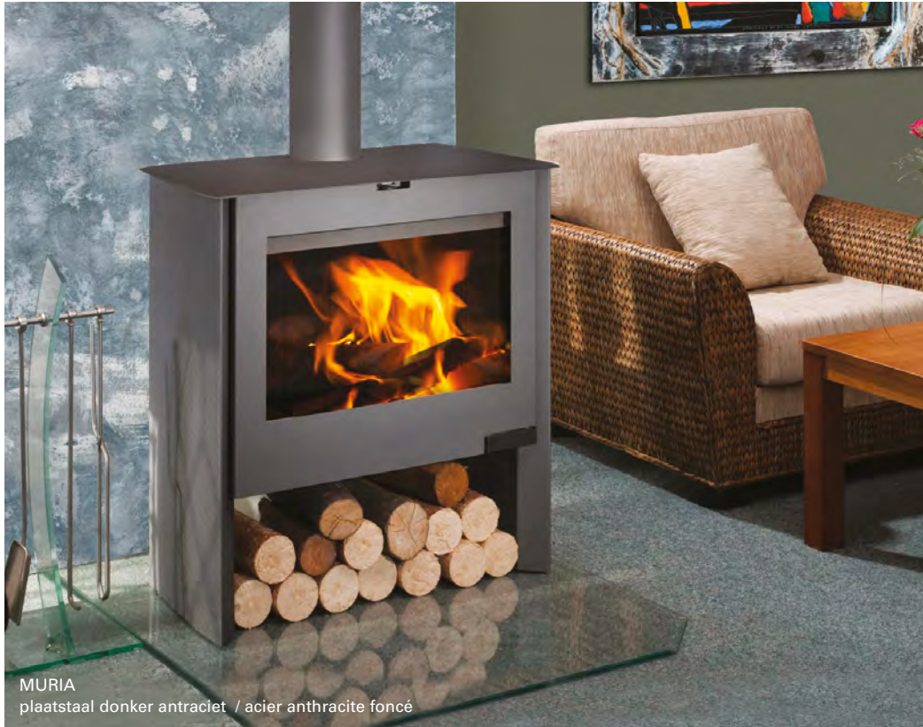
MURIA plaatstaal donker antraciet / acier anthracite foncé

Traditionele harmonieuze vormgeving die zich beperkt tot de essentie.