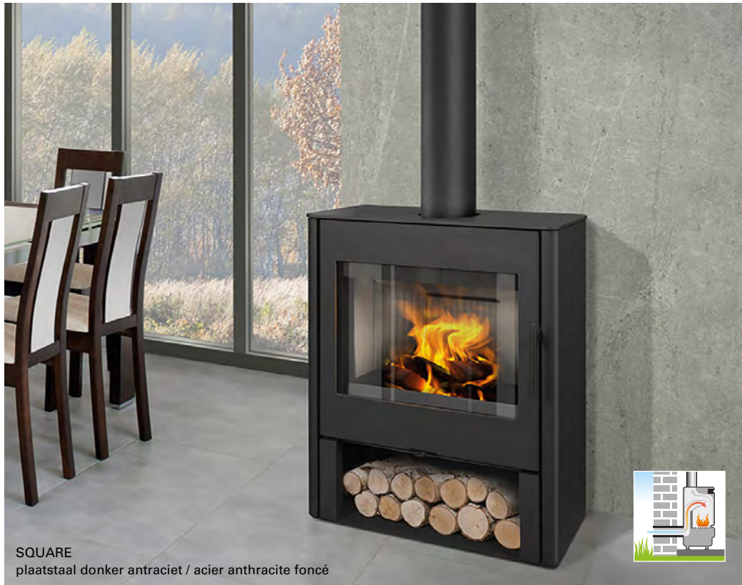
SQUARE plaatstaal donker antraciet / acier anthracite foncé

De Square staat voor kubistische eenvoud.