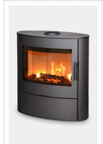
ELLIPS staal donker antraciet acier anthracite foncé

Une belle vue panoramique sur les flammes dans un design souple et courbé.