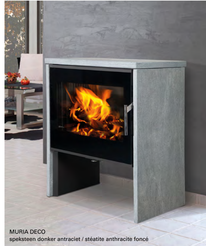
MURIA DECO speksteen donker antraciet / stéatite anthracite foncé

Een breed vlammenbeeld in een verfijnd modern jasje.