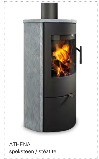
ATHENA speksteen / stéatite

→ niche à bois fermée → vitre bombée → raccord air extérieur Ø 120 mm arrière et dessous