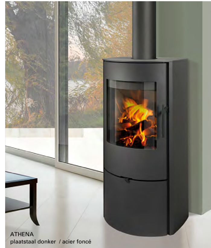
ATHENA plaatstaal donker / acier foncé

De Athena is een verfijnde kachel met een onopvallend ingewerkte houtopslag.