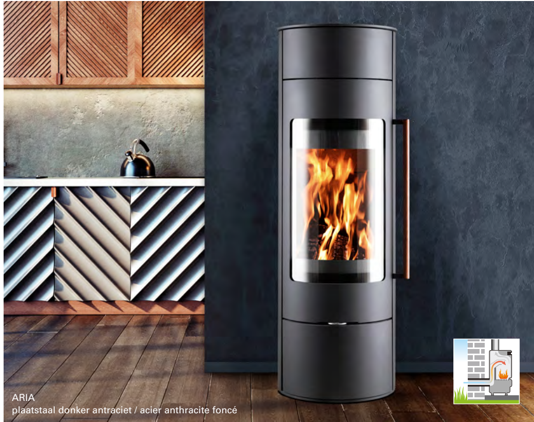
ARIA plaatstaal donker antraciet / acier anthracite foncé