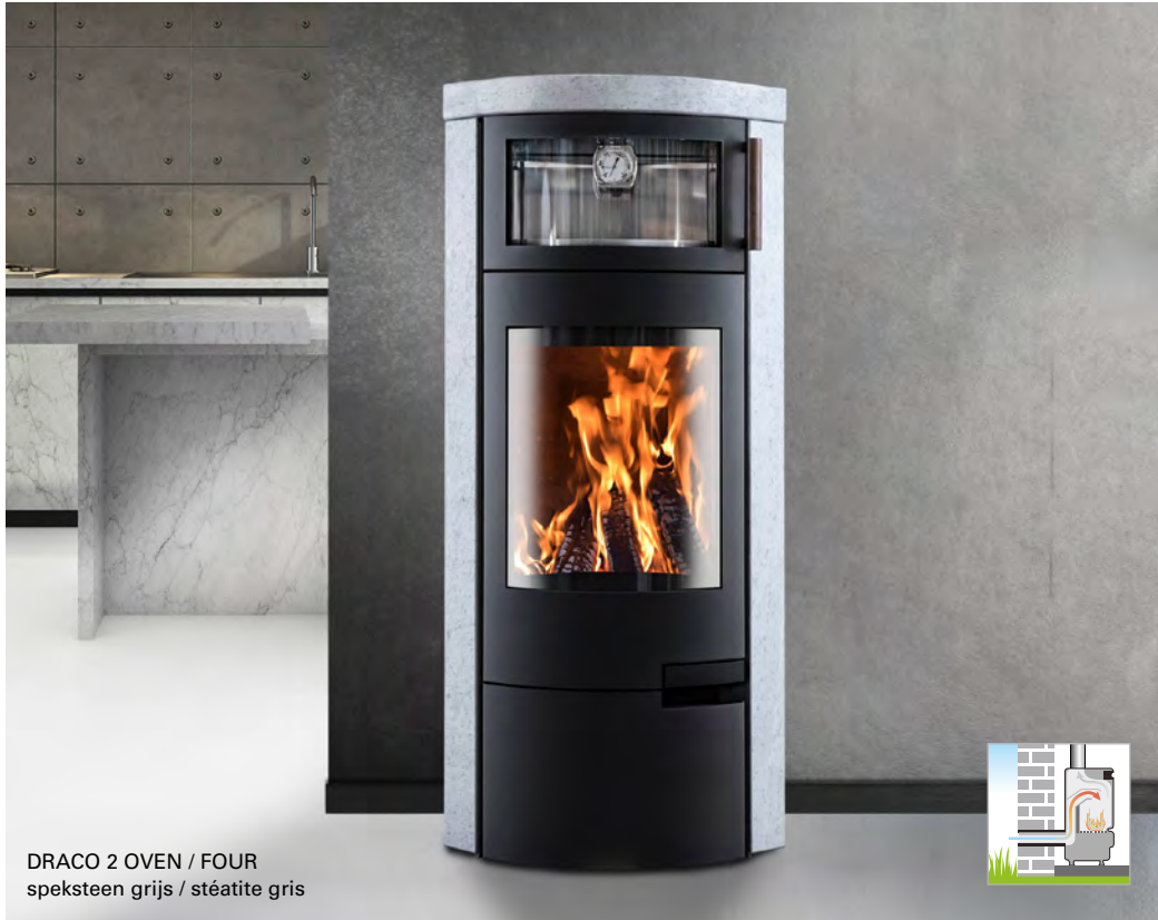
DRACO 2 OVEN / FOUR speksteen grijs / stéatite gris