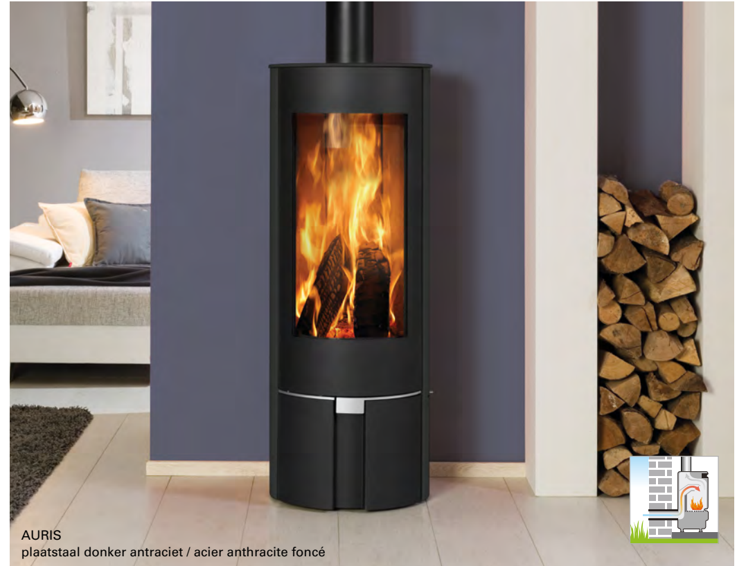
AURIS plaatstaal donker antraciet / acier anthracite foncé

Ronde, hoge stijlvolle houtkachel met een betoverend vlammenspel !