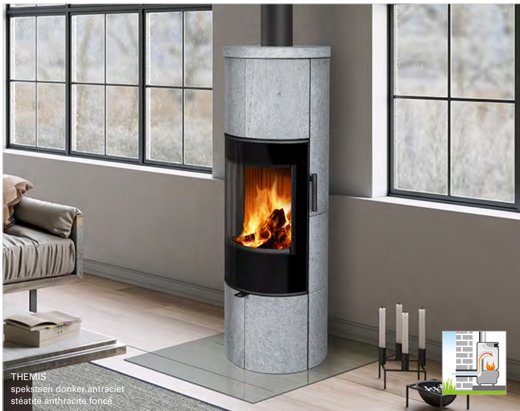
THEMIS speksteen donker antraciet stéatite anthracite foncé