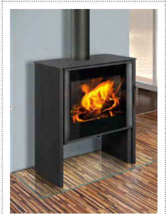
MURIA DECO staal donker antraciet acier anthracite foncé