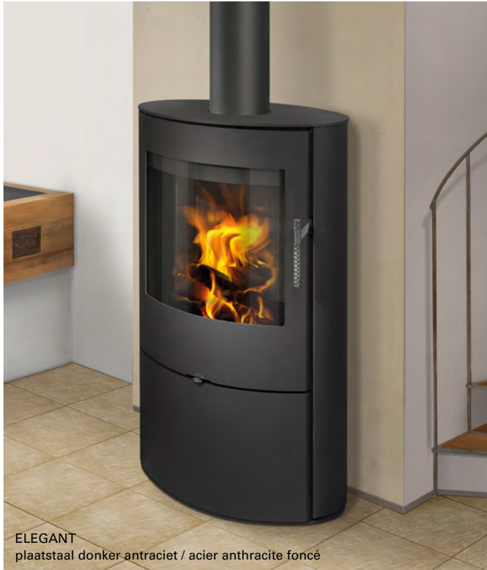
ELEGANT plaatstaal donker antraciet / acier anthracite foncé